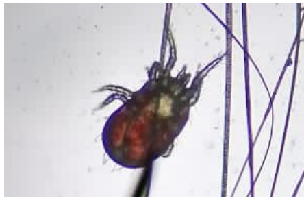
Blutsaugende Milbe: es besteht Handlungsbedarf. Je nach Milbenart schaut die Behandlung unterschiedlich aus, deshalb ist eine exakte Bestimmung unbedingt notwendig.