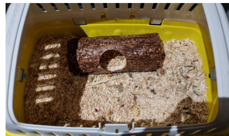
Hamster-Transport zum Tierarzt