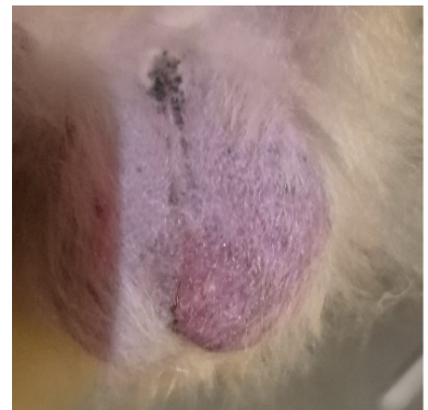
roter, geschwollener Hoden (rechts) Diagnose: verdrehter Hoden