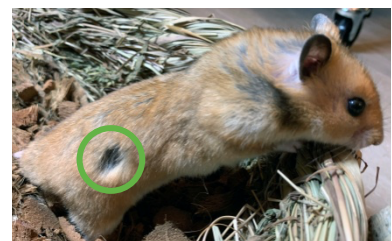
Duftdrüse bei Mittelhamster