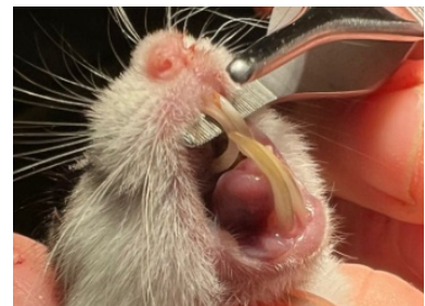
zu lange und schief wachsende Zähne