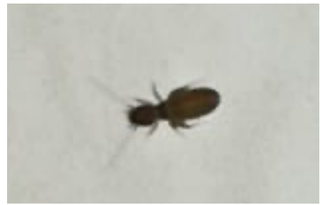
Harmlose Staublaus (tritt recht häufig auf): ernährt sich von Schimmel, Pilzen und Sporen. Meist reicht es stark befallene Stellen abzusaugen, die Pipiecken regelmäßig, großflächig zu wechseln, sowie den Bereich um den Wassernapf trocken zu halten.